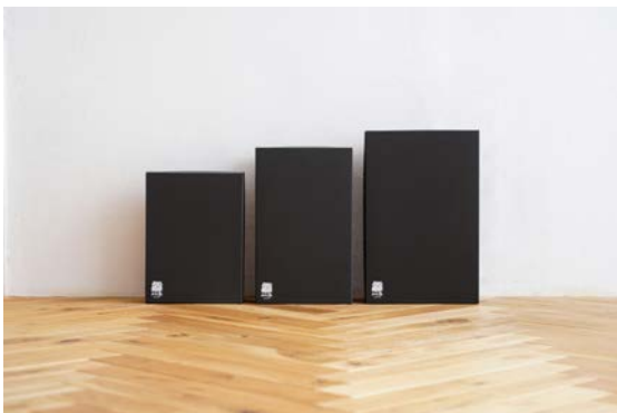
贈答用ギフトボックス